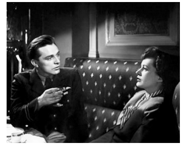
1949 AMOURS PERDUES (The Woman with no name) de George More O'Ferrall avec Richard Burton