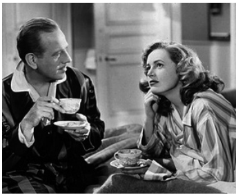
1948 MON VÉRITABLE AMOUR (My own true Love) de Compton Bennett avec Melyvn Douglas