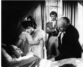
1943 L'HOMME EN GRIS (The Man in Grey) de Leslie Arliss avec M. Lockwood, J. Mason