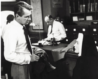
1950 ÉCHEC AU HOLD-UP (Appointment with Danger) de Lewis Allen avec Alan Ladd