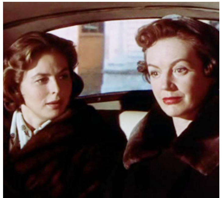
1958 INDISCRET (Indiscreet) de Stanley Donen avec Ingrid Bergman