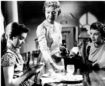
1956 CHILD IN THE HOUSE de Cyril Endfield avec Mandy Miller, Dora Bryan