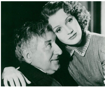
1940 THEY CAME BY NIGHT d'Harry Lachman avec Will Fyfe