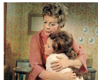
1969 QUI VEUT LA FIN (The walking Stick) d'Eric Till avec Samantha Eggar