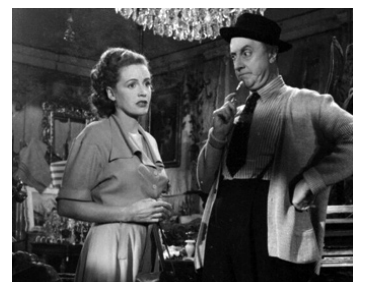
1948 LA MADONE D'OR (The golden Madonna) de Ladislao Vajda avec Franco Coop