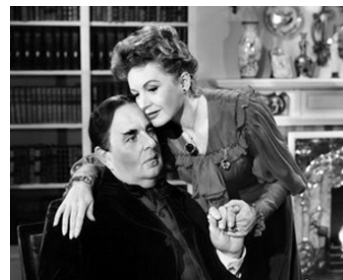
1959 OSCAR WILDE (Forbidden Passion) de Gregory Ratoff avec Robert Morley