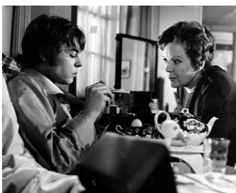
1968 SOUS L'EMPRISE DU DÉMON (Twisted Nerve) de Roy Boulting avec Hywell Bennett