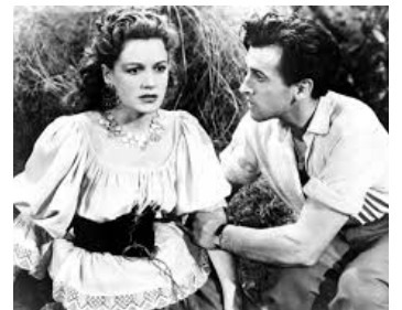
1944 LA MADONE AUX DEUX VISAGES (Madonna of the seven Moons) d'A. Crabtree avec S. Granger