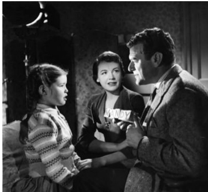
1952 MANDY (Crash of Silence) d'Alexander Mackendrick avec Mandy Miller, Jack Hawkins