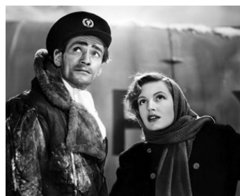
1948 VOYAGE BRISÉ (Broken Journey) de Ken Annakin avec Derek Bond