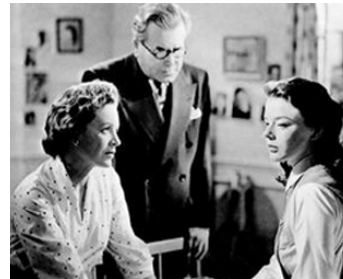
1957 THE YOUNG AND THE GUILTY de Peter Cotes avec Edward Chapman, Janet Munro