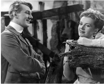
1941 KIPPS (The remarkable Mr Kipps) de Carol Reed avec Michael Redgrave