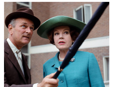
1966 DES ÉTOILES DANS MES YEUX (The Stars in my Eyes) d'A. Rakoff avec Nigel Patrick