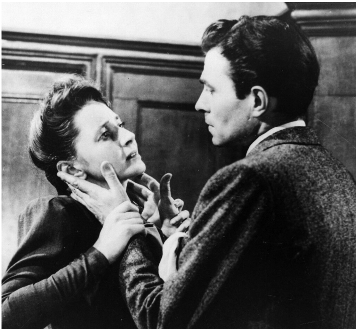
1945 LE TYRAN ou ELLES ÉTAIENT SŒURS (They were Sisters) d'Arthur Crabtree avec James Mason