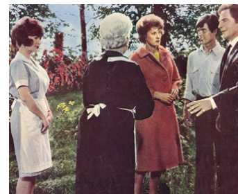
1964 LE SCANDALE DE LA VILLA FIORITA de Delmer Daves avec M. O'Hara, R. Brazzi