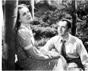
1942 UNCENSORED d'Anthony Asquith avec Eric Portman