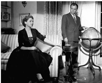
1953 M7 NE RÉPOND PLUS (The Net) d'Anthony Asquith avec Herbert Lom