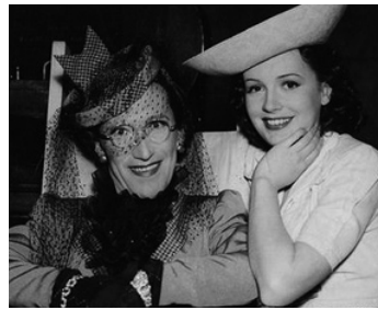
1940 LA MARRAINE DE CHARLEY (Charley's big-hearted Aunt) de W. Forde avec A. Askey