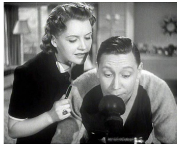
1940 LET GEORGE DO IT de Marcel Varnel avec George Formby