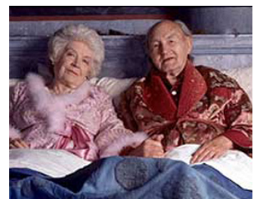
1996 MRS DALLOWAY (Mrs Dalloway) de Marleen Gorris avec Maurice Denham