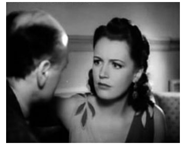
1941 LE TRAIN POSTAL (Inspector Hornleigh goes to it) de Walter Forde avec Alastair Sim