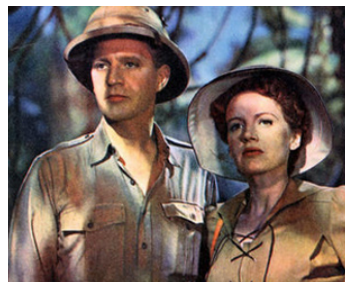
1945 LE SORCIER NOIR (Men of two Worlds) de Thorold Dickinson avec Eric Portman