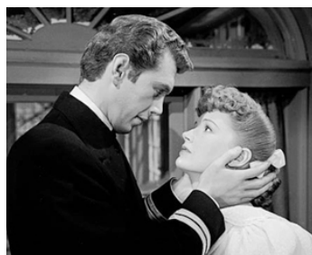
1947 DÉSIR DE BONHEUR (Time out of Mind) de Robert Siodmak avec Robert Hutton