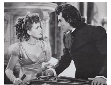
1946 L'ARCHET MAGIQUE (The Magic Bow) de Bernard Knowles avec Stewart Granger