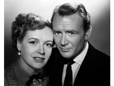
1952 LE SECRET DE TOM DENNING (Mr Denning drives North) d'A. Kimmins avec John Mills