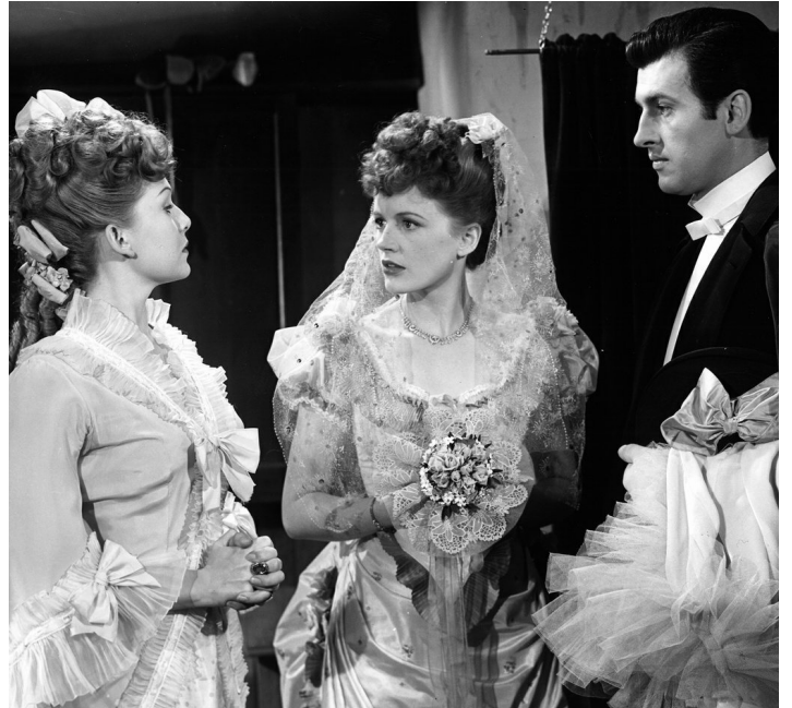
1943 L'HOMME FATAL (Fanny by Gaslight) d'Anthony Asquith avec Jean Kent, Stewart Granger