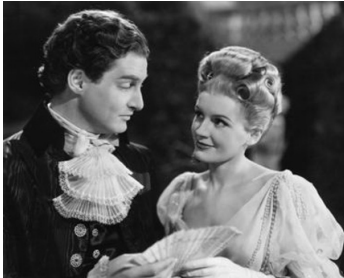
1942 LE JEUNE MONSIEUR PITT (The young Mr Pitt) de Carol Reed avec Robert Donat